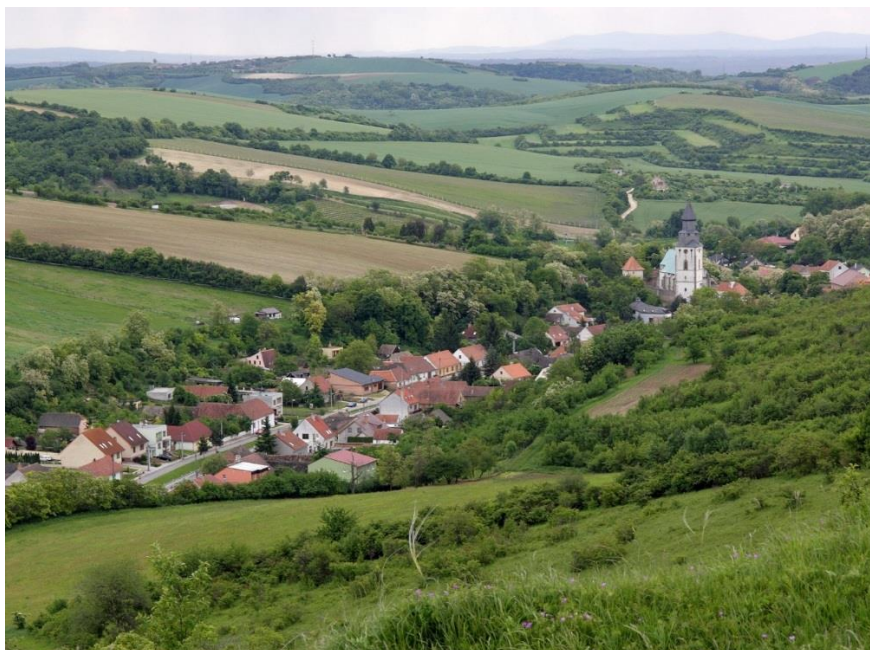
Aussicht über Kurdějov

Kurdějov liegt in einer für Südmähren typischen Landschaft, mit kleinen Hügeln, Weinbergen, Feldern, Obstgärten und Fragmenten von Pannonischen Trockenrasen und wärmeliebenden Eichenwäldern, die einen hohen Artenreichtum an Pflanzen und Insekten aufweisen. In der Nähe des Hotels befinden sich interessante Gebiete für Zikadenexkursionen. Direkt gegenüber des Hotel gibt es eine befestigte Kirche mit Untergrundgängen aus dem 16. Jahrhundert.