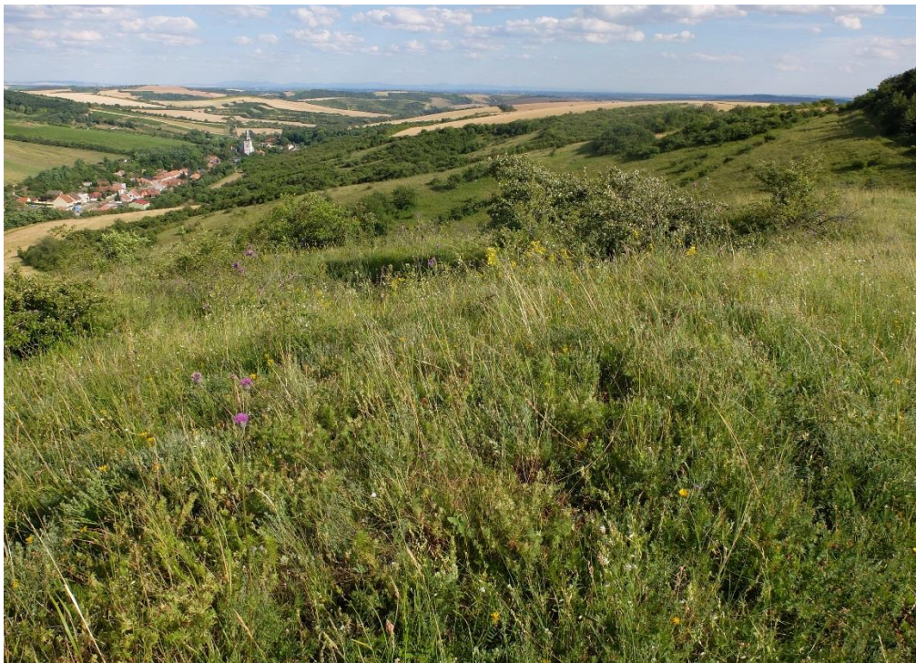
Pannonische Trockenrasen im Naturschutzgebiet „Kamenný vrch u Kurdějova“ (Foto: I. Malenovský).